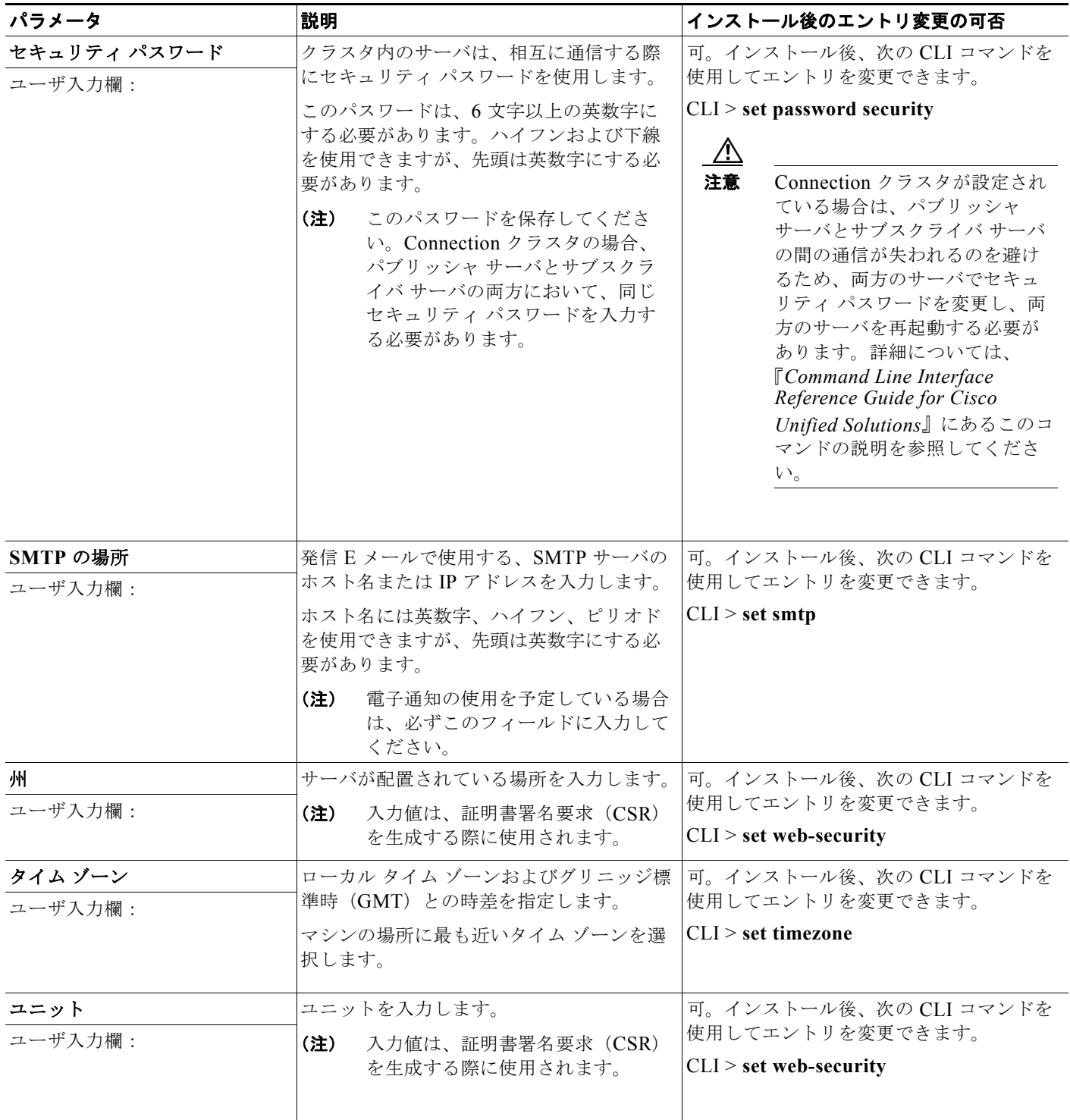
表 2-7 サーバ設定データ (続き)