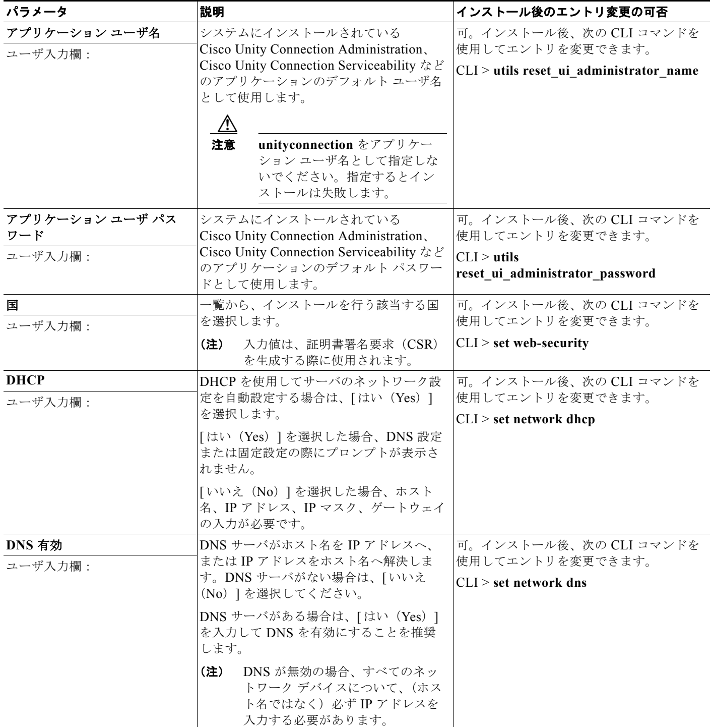
表 2-7 サーバ設定データ (続き)