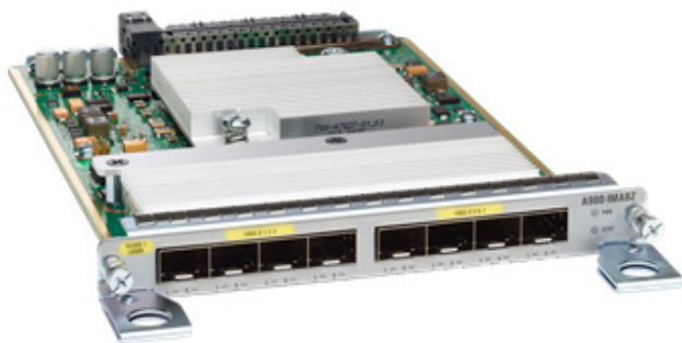
図 2. Cisco NCS 560 シリーズ ルータ インターフェイス モジュール : 10GE (SFP+) X 8