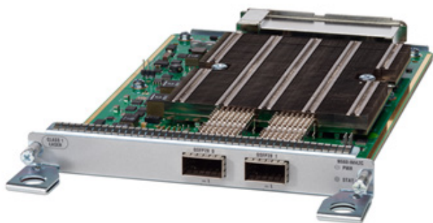
図 1. Cisco NCS 560 シリーズ ルータ インターフェイス モジュール : 100GE (QSFP28) X 2

Cisco®NCS 560 シリーズ ルータは、プロトコルに依存しないファブリックアーキテクチャをベースに、コスト効率の高いモジュラ型ソリューションを提供します。Cisco Evolved Programmable Network (EPN) アーキテクチャの一部として、冗長化によって保護されたパケットベースのネットワークテクノロジー (IP/MPLS、MPLS -TE、SR、SR-TE、TI-LFA) を介して、キャリア イーサネット ビジネス サービスにおいて無制限の拡張性と優れた機能を提供します。