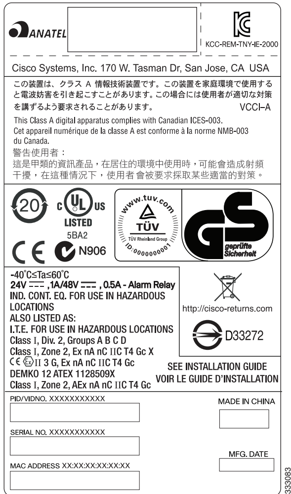
Figure 1 Cisco IE 4010 and IE 5000 Switches Compliance Label

The compliance label for the switch is shown in Figure 1 .